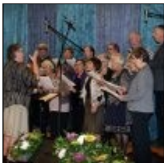
Ø-koret ved årsmødet 2010

Ud over LM-arrangementer har vi holdt koncerter især ved højtiderne. Det har været i både kirker og missionshuse og ofte sammen med hornorkesteret. Vi har dog også sunget i andre sammenhænge, når vi er blevet spurgt og har kunnet få det til at passe i programmet.