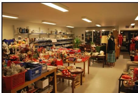
Stort vareudbud i butikken

Alle er enige om, at man ønsker sig flere kolleger, og at der stadig afleveres gode brugte ting til at sælge. Hvis man ringer, afhentes tingene gerne.