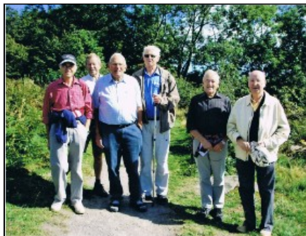
M60+ på tur i Aakirkeby

At nogle samles til andagt og bøn, er naturligvis en del af missionsforeningens opgave. Hensigten er derudover at vi på denne måde skulle få kontakt til nogle, som ikke ellers har deres gang i missionshuset. Vi tror jo også, at det har betydning, at missionsforeningen har omsorg for det hele menneske.