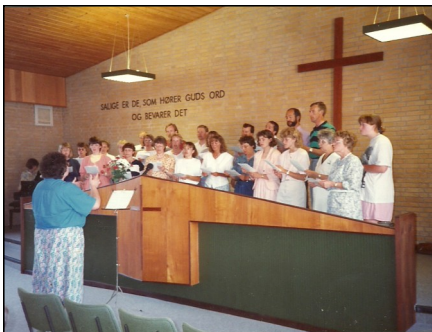
Ø-koret i 90-erne