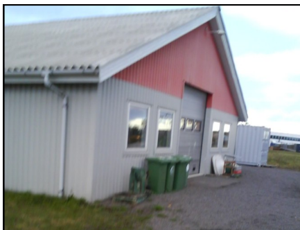
Her skal der udvides.

Butikken i sig selv er en missionsstation, konkluderes det. Man får ofte gode samtaler, og der uddeles jævnligt materiale om, hvad overskuddet går til.