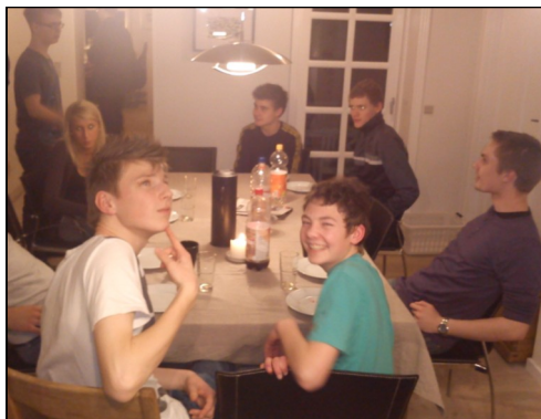
LMU-erne satser også på det sociale

Til sidst vil jeg sige TAK for forbøn for LMU og de aktiviteter, der er på øen, det har vi brug for.