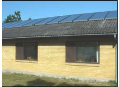
De nye solceller på taget