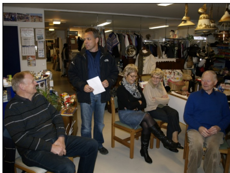
Tak til LUMI Genbrugs medarbejdere

Det er en alvorlig situation, vort land og vor kirke er i. Ubibelsk lære og praksis flourerer. LM er kun en lille bevægelse, men lad os prioritere at mødes til bøn i uge 2 for at bede om Guds indgriben. Hans magt og kærlighed er stor.