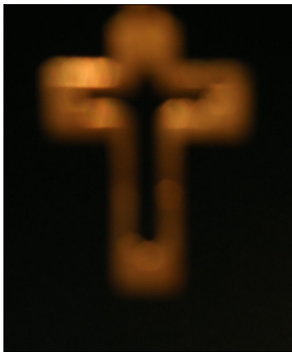
Fokus på korset når vi beder

Traditionelle bedemøder har Rønne LM ikke haft i mange år. Forbønnen er nu lagt ind i andre rammer. Ved nogle møder har man forbønshandling, hvor tre fra kredsen beder for de forskellige grene af LM's arbejde. Et par gange årligt har man bøn og lovsang til et tirsdagsmøde. Endelig er der 6 til 8 gange om året mulighed for forbøn.