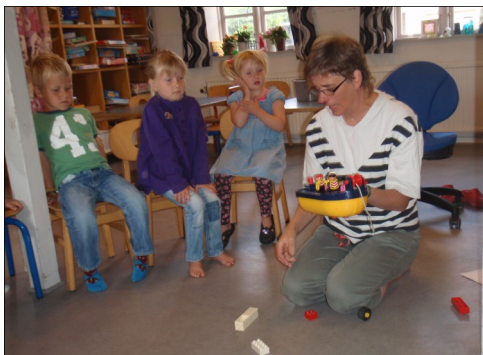
Morgensamling i Børnebakken