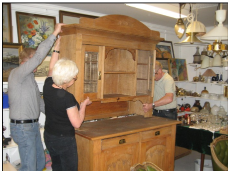
Pas på de tunge løft!

LM har inviteret til inspirationsmøde i Odense. Som leder af arbejdet har man behov for nye input, og programmet ser spændende ud.