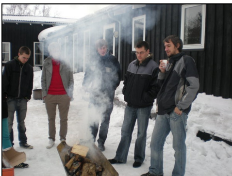
TMU-lejr på LM-lejren