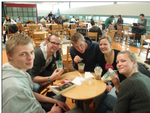
På vej hjem fra Israel

Og så fordi det er en fantastisk oplevelse, man ikke må gå glip af!