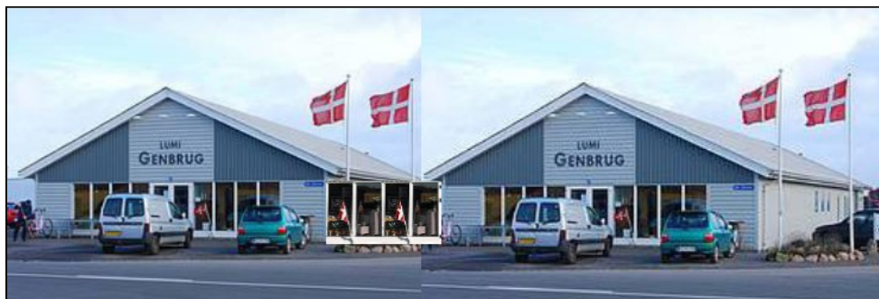
Plan for udbygning af LUMI Genbrug i Nexø

Planen er at lave en bygning, hvor facaden er mage til den eksisterende, og de to bygninger forbindes med et nyt indgangsparti. Mellem bygningerne skal der være en plads til af- og pålæsning af varer. Vi glæder os til de nye faciliteter, som også kan give bedre arbejdsforhold for de mange medarbejdere - og forhåbentlig et endnu større overskud til missionsarbejdet.