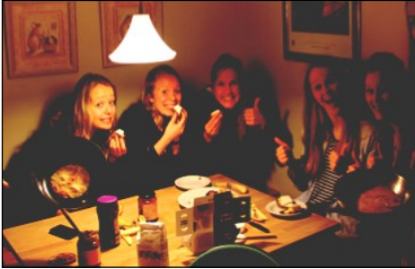
Hygge i pigekøkkenet

De sidste 10 måneder for mig på LMH er gået virkelig stærkt, og der er sket rigtig meget. Jeg har udviklet mig meget og fået større personlig kendskab til mig selv. Samtidig har jeg været del af et godt kristent fællesskab.