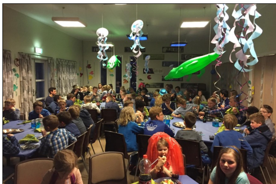
Festaften i 2016

Påsken 2016 havde vi 80 deltagere og 20 på venteliste, samtlige rum og madrasser var taget, ja selv en campingvogn måtte i brug. Vi havde mulighed for at fortælle 80 juniorer om Jesus, vise dem et trygt og godt fællesskab, der er grundfæstet i vores kristne livssyn. Det er svært at få armene ned af begejstring efter sådan en oplevelse! Men hænderne kan hurtigt ryge i lommerne igen, derfor må vi fortsat opfordre hinanden til, at lejrlivet skal fortsætte, også på solskinsøen! Vi må bede Gud om at udruste, give kræfter og glæde til dette. I år bliver timerne om påskens budskab – det har vi hvert andet år. Der bliver derudover sjov og ballade, bøn og lovsang – og vi er overbeviste om, at vi 11. april igen vil høre en masse juniorer, der synes, at lejren var alt for kort, sagt med meget tunge øjenlåg 😊