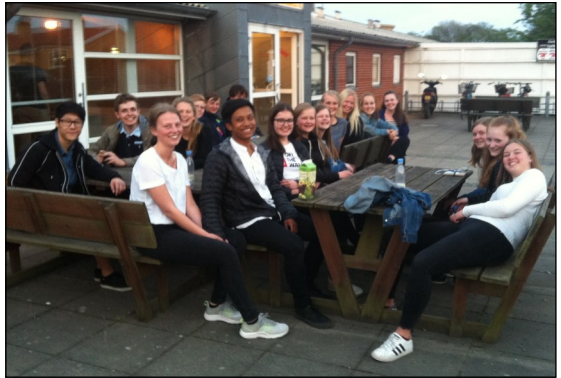
LMU i "Østerballe"

bad så for vores svært hjerneskadede barnebarn, og den unge bad en bøn om, at hendes liv må blive til Guds ære. Det gjorde et dybt indtryk på mig, og jeg har efterfølgende flere gange tænkt på den visdom, der ligger bag denne bøn.