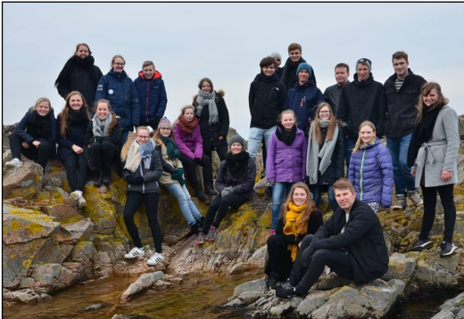
LMU på tur

Jeg ser mig selv som en slags mentor for de unge. Det er vigtigt, at det er en af deres egne, der er formand, og at han / hun får lov at vokse med opgaven. Her kan jeg bakke op, støtte og være den, som formanden kan konsultere. Jeg deltager i bestyrelsesmøderne og er af og til med til møderne i LMU. Udskiftningen i LMU er stor, og her kan jeg være den stabile faktor, som kan gøre overgangen lettere for de nye, der skal tage over.