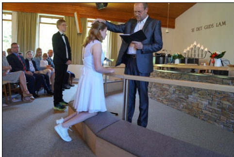
Den første konfirmation i kirken

Der har været 3 dåb og i år konfirmation af 2 konfirmander. Indtil videre har der ikke været bryllup eller begravelse. Kirken er ikke et anerkendt trossamfund, så man har ikke vielsesret.