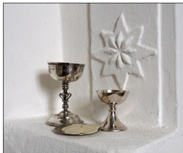
Fra Skt. Peders Kirke.

Jeg er overbevist om, at Gud formår at bevare sin kirke uden nadverfejring, når vi i denne tid mødes online, lige så længe han lader denne situation vare. Han har bevaret kirken under større indskrænkninger af normalt gudstjenesteliv end dette. Og gør det fremdeles mange steder i verden.