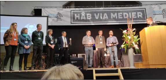
Ansatte i Norea Danmark

Radiomonopolet gjorde, at det ikke var muligt at sende fra dansk grund. Udsendelserne kom i stand efter opfordring fra Norea Norge og med accept fra LM Landsstyrelse.