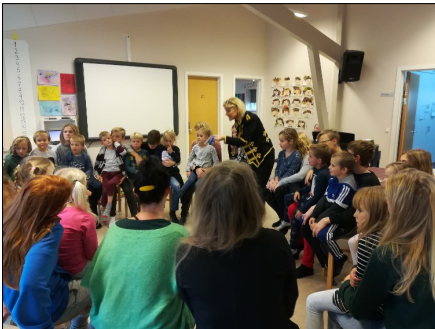
Julefejring på Peterskolen