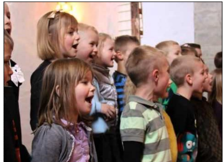
Påskefejring på Davidskolen