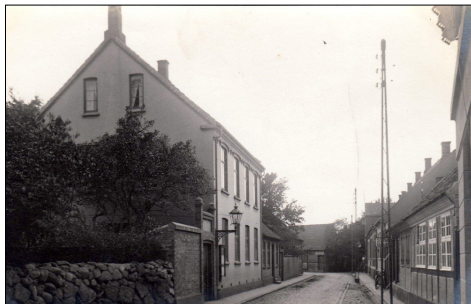
Mødesalen, efter at Bornholms Tidende havde købt den og bygget en etage på